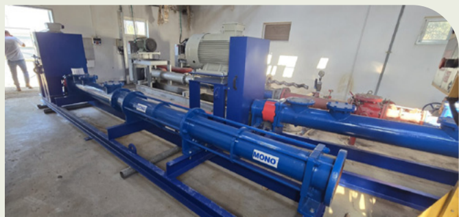
שדרוג תחנות שאיבה