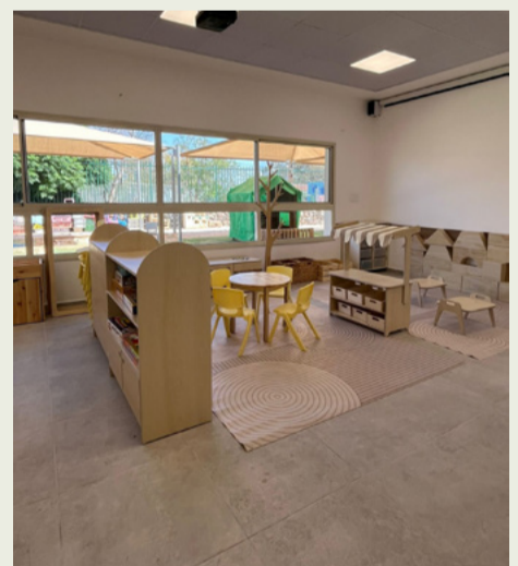
גן אליפלט תמונות לפני ואחרי