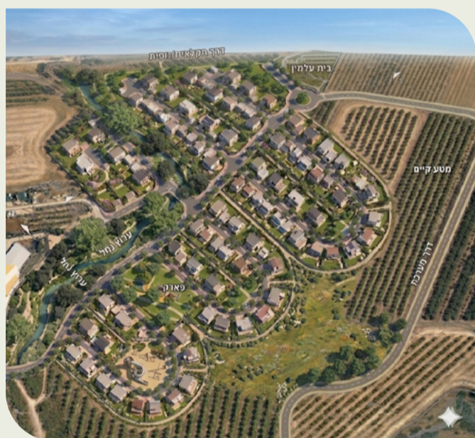
הדמיית הרחבת שאר יישוב - נערכה על ידי האדריכל רודי ברגר

המועצה ממשיכה לקדם את תכנון והקמת ההרחבות ביישובים השונים. בימים אלה מקודמת הרחבת שאר יישוב, הכוללת כ-100 יחידות דיור חדשות.