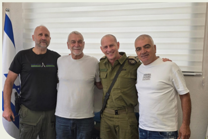
ביקור מפקד פיקוד הצפון, אלוף רפי מילוא