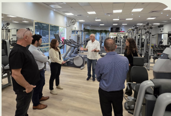
ביקור ממונה אגף התקציבים