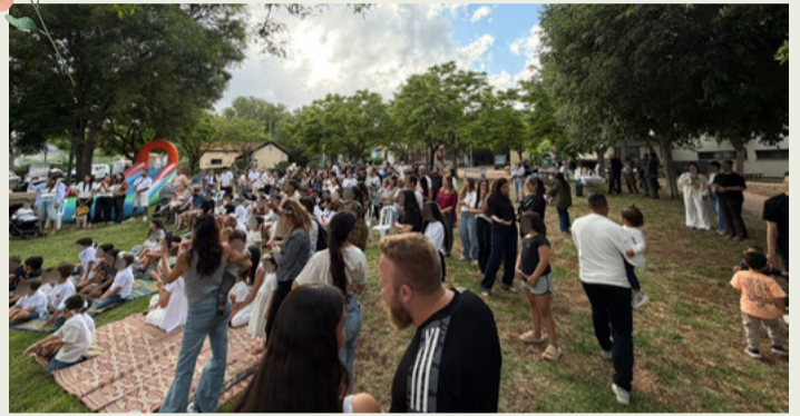
חגיגות חג שבועות ביישובי המועצה

בתקופה המורכבת הזו ועל הצרכים שעולים מהשטח. בנוסף, הוצגו תוכניות להמשך, ימי הפגה, מענים קהילתיים ודרכים להמשיך ולחזק את הליווי, החיבור והתמיכה במשפחות המילואים.