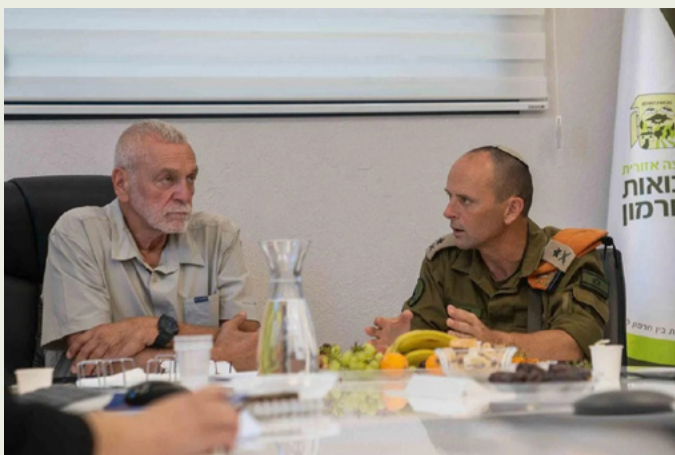
ביקור מפקד פיקוד העורף, אלוף שי קלפר