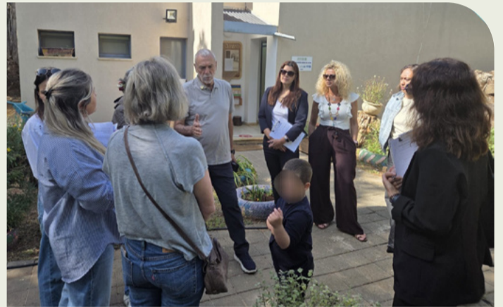
ביקור ועדת הבחינה הארצית לפרס - יובל

אני גאה מאוד בצוות אגף החינוך ובשותפים שלנו לדרך, ומאמינה שהעשייה החינוכית במועצה היא כוח משמעותי בבניית קהילה חזקה, מחוברת וצומחת".