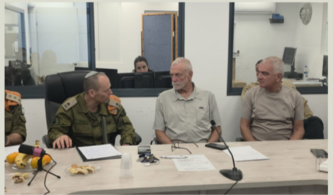
מפקד פיקוד העורף, האלוף שי קלפר.