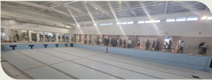
אחד הפרויקטים מבין רבים שממשיכים בעבודה גם תחת אש

מחכים כבר לקבל את פניכם במרכז המחודש, עם מרחב משודרג ומזמין, לבריאות הגוף והנפש.