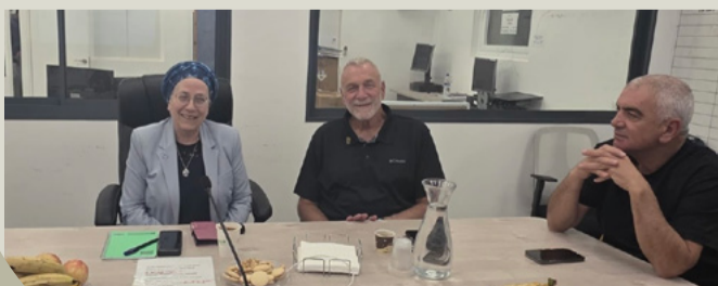
השרה למשימות לאומיות, ח"כ אורית סטרוק.