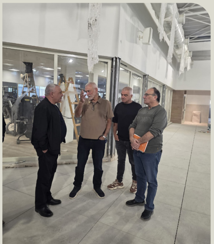
רא"ל (במיל) גדי אייזנקוט, הרמטכ"ל לשעבר.