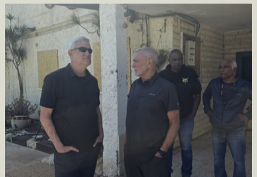
השר לבטחון לאומי, ח"כ איתמר בן גביר.